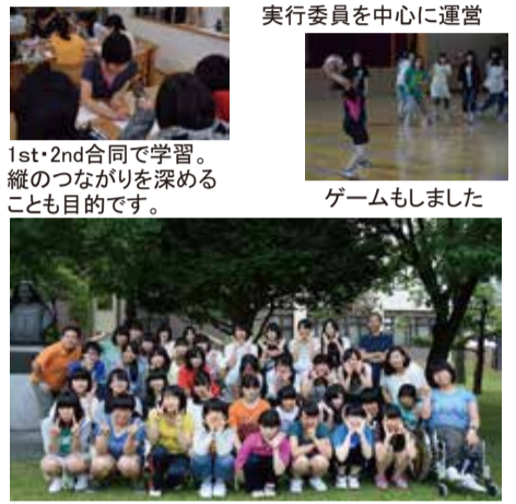
昨年続き2年目となりました。改良を加え次回へ