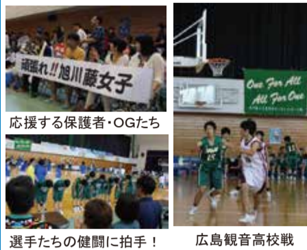
応援する保護者・OGたち 選手たちの健闘に拍手!

千葉県八千代市で行われた第六七回全国高等学校バスケットボール選手権大会に出場しました。一回戦で広島観音高校と対戦し惜敗しました。皆様の応援、ありがとうございました。今回の経験を活かして、再び全国大会に出場して勝利をめざします。