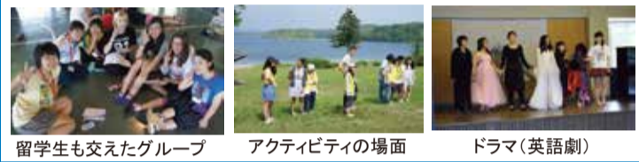
留学生も交えたグループ アクティビティの場面 ドラマ(英語劇)

道内の留学生13名も一緒に参加しました。1stは留学前の研修のひとつとして、2ndは留学経験を活かし、さらに企画運営能力を高めるために実行委員会を中心に運営していきます。