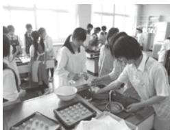
家庭科クッキー作り体験