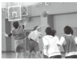
バスケットボール体験